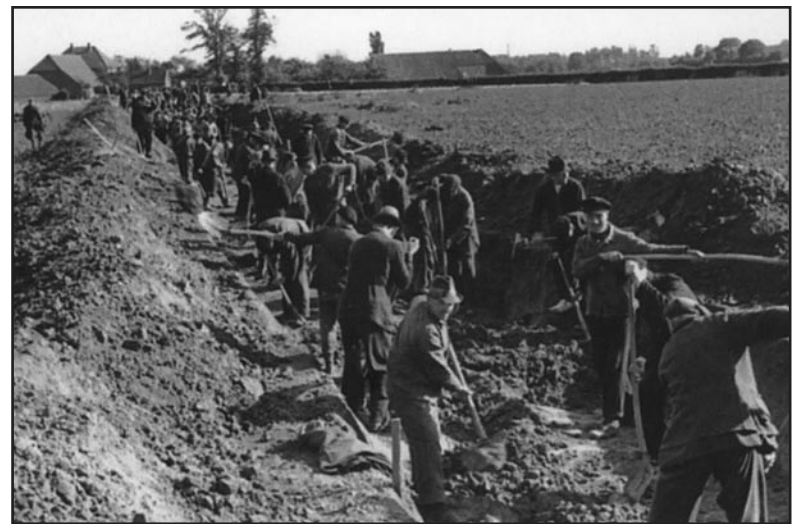
Graafwerk voor de loopgraven tijdens de Tweede Wereldoorlog.

"Daardoor heb ik de Liemers goed in het boek kunnen zetten. Juist de kleinere plaatsen krijgen aandacht, met echte, uit het leven gegrepen verhalen. Veel drama, maar er zit ook veel humor in. Een van de zeldzame foto's in het boek is die genomen vanuit het gemeentehuis in Pannerden, naar de kerk