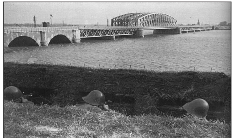
Nederlandse militairen bij Fort Westervoort in een loopgraaf langs de IJssel. Ze bewaken de Westervoortse brug tijdens de mobilisatie in 1940.